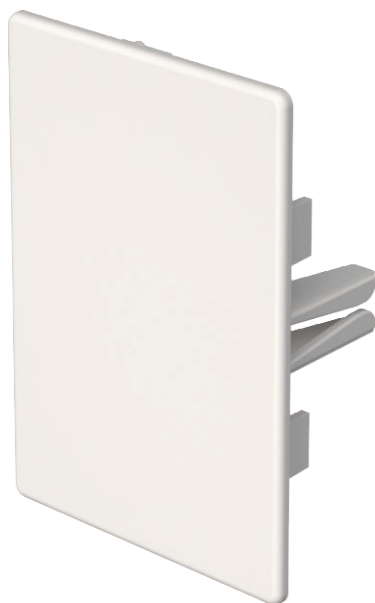
Końcówka do zamknięcia kanałów WDK.